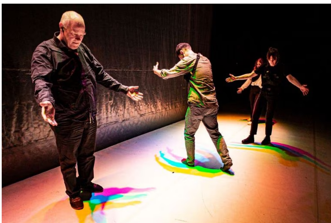
Rituels du désordre, une expérience chorégraphique immersive.